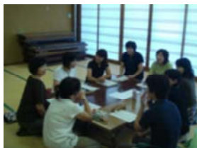
【健康相談活動グループ】

健康相談活動、基本的な生活習慣、保健管理の3つのグループに分かれ、それぞれのテーマに沿った研修を深めています。