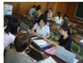
【保健管理グループ】