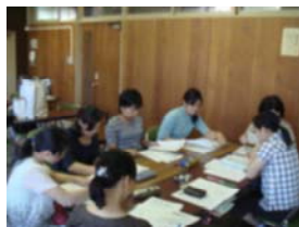
【基本的な生活習慣グループ】